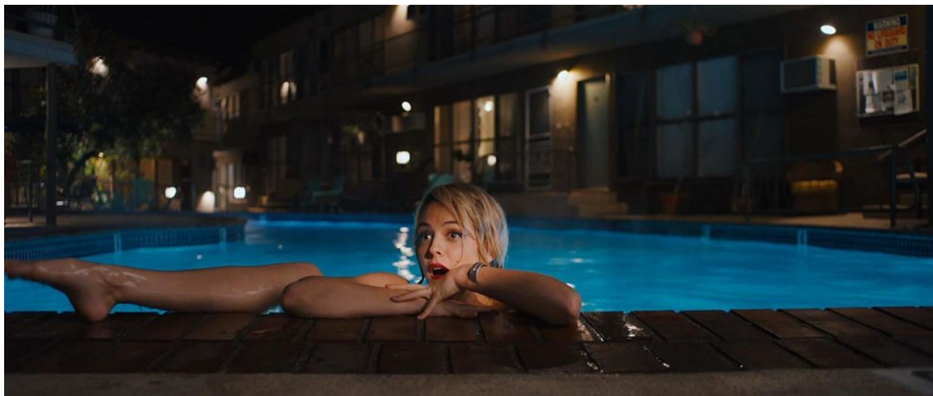
Escena de Under the Silver Lake en homenaje a la actriz Marilyn Monroe.

La publicación del citado artículo coincidió con la permanencia por tercera semana en la cartelera cinematográfica de Santo Domingo de una película en que Playboy está presente: “Under The Silver Lake” (David Robert Mitchell, 2018), cuyo protagonista, interpretado por Andrew Garfield, conserva un ejemplar de la revista, correspondiente a la edición de julio de 1970, cuya portada muestra una foto bajo el agua de una mujer desnuda, la cual le motivó su primera masturbación, según él cuenta a los pocos minutos de haber comenzado la película.